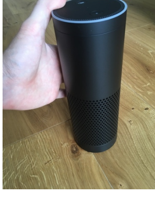
Il mio Amazon Echo

Con Amazon Echo è possibile parlare con Alexa e dare comandi vocali che vanno prima inseriti tramite tastiera.