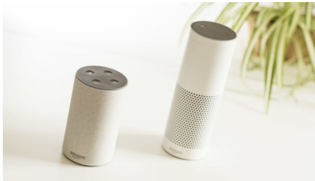
Amazon Echo di 2a e 1a generazione a confronto

Amazon Echo di seconda generazione è un po' più largo, ma molto più basso (14,8 centimetri invece dei 23,5 centimetri). Esternamente Amazon Echo di 2a generazione si distingue con nuovi gusci colorati (tessuto, sabbia, noce, rovere...).